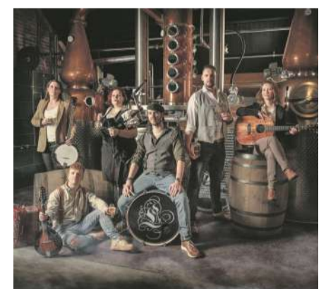
Met de folkband Lads 'n Lassies gaat het dak van De Pol er gegarandeerd af!

En dat is veel! Ondernemers presenteren zich in mooie stands, om trots te laten zien waartoe ze in staat zijn. Daaromheen wordt een dagvullend cultureel programma van hoog niveau ingevuld door de Gaanderense verenigingen, waaronder SBOG, MPG en Gaanderens Mannenkoor, ieder met een regionaal en zelfs provinciaal publiek. Ook wordt een uitgebreid programma opgezet door de sportverenigingen, met inbreng van veel jeugdleden (demonstraties, minicursussen), verenigingen (workshops, masterclasses) en maatschappelijke organisaties die voor allen klaarstaan (lezingen en demonstraties).