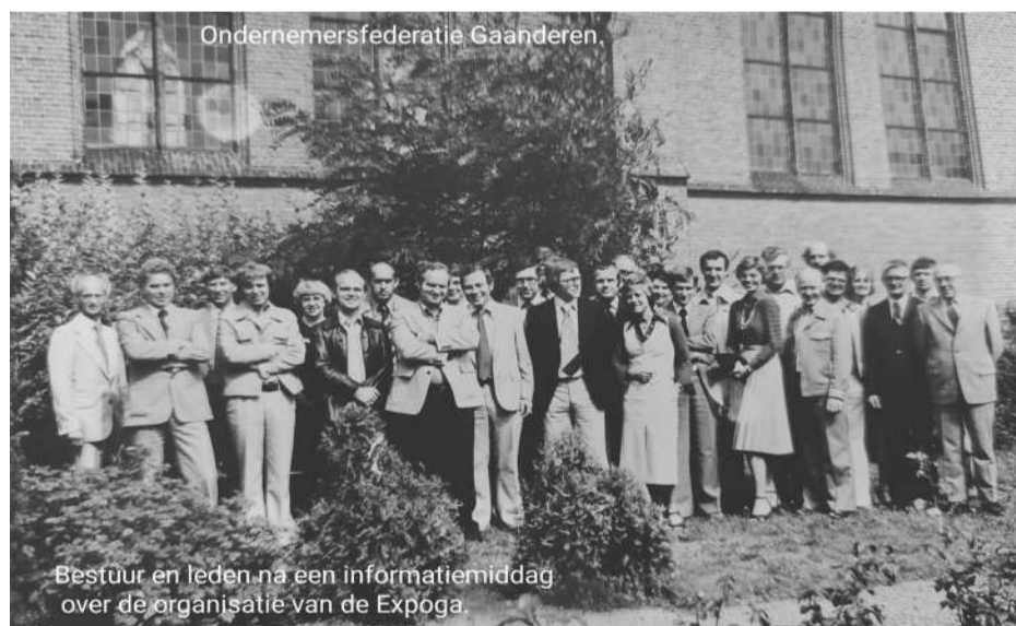
Bestuur en leden na een informatiemiddag over de organisatie van de Expoga.