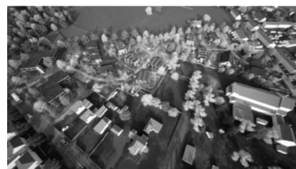
Foto: sfeerbeeld uit het beeldkwaliteitsplan Augustinuspark, wonen aan de rivierduinen, maart 2024. Een sfeerimpressie van de toekomstige wijk in vogelvlucht. De bebouwing en de beplanting zijn indicatief. Rechts bovenin: fase 1, het perceel van de Augustinusschool, links het deel St. Jozefterrein fase 2, dat in een later stadium wordt uitgewerkt.

Op www.doetinchem.nl/het-augustinuspark vindt u de meest actuele informatie over het project.