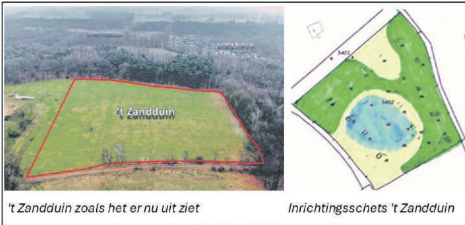
't Zandduin zoals het er nu uit ziet