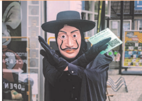
Foto: In september werd de mysterieuze Mister X, boegbeeld van de Expoga, na zo'n 40 jaar afwezigheid weer gespot.

In de jaren '70 en '80 was Sporthal De Pol in Gaanderen één weekend per jaar het stralende middelpunt van de Achterhoek met de Expoga. Een bruisende ondernemersbeurs met volop entertainment en niet te vergeten, de mysterieuze 'Mister X'. Dit jaar vieren de sporthal en enkele verenigingen hun 50-jarig jubileum. Dat gaan ze groots vieren met alle verenigingen, ondernemers én inwoners van Gaanderen (en omstreken). En wel met eigentijdse versie van de Expoga.