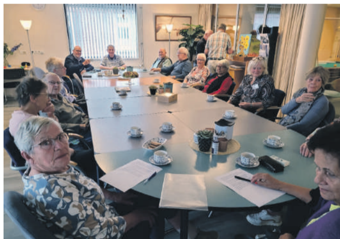
Foto : Inloop Gaanderhuus nu op dinsdagmiddag en woensdagochtend

Kortom, de inloopbijeenkomsten op dinsdag en woensdag in het Gaanderhuus zijn de hoogtepunten van de week voor veel inwoners van Gaanderen. Ze bieden niet alleen een kans om contacten te onderhouden, maar ook om nieuwe mensen te ontmoeten, allemaal in een hartelijke en gastvrije omgeving. De koffie staat klaar!