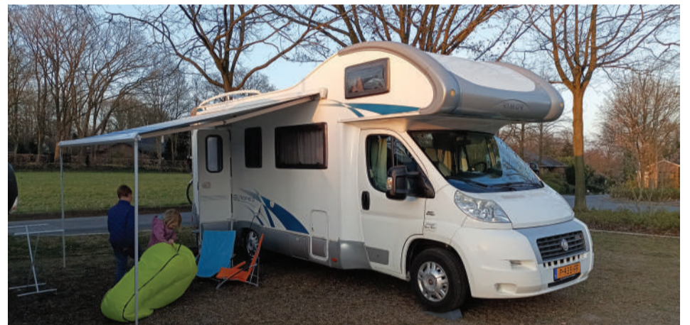
Op de foto: 'proef' camperen met de camper

met een gezin voor lange tijd op reis te gaan. Ik kwam verschillende verhalen tegen van gezinnen die het gedaan hebben of die het nu aan het doen zijn en er zijn heel veel rondreizende mensen zonder kinderen. Het lijkt voor veel mensen zelfs geen probleem om met die levenswijze hun geld te verdienen als digital