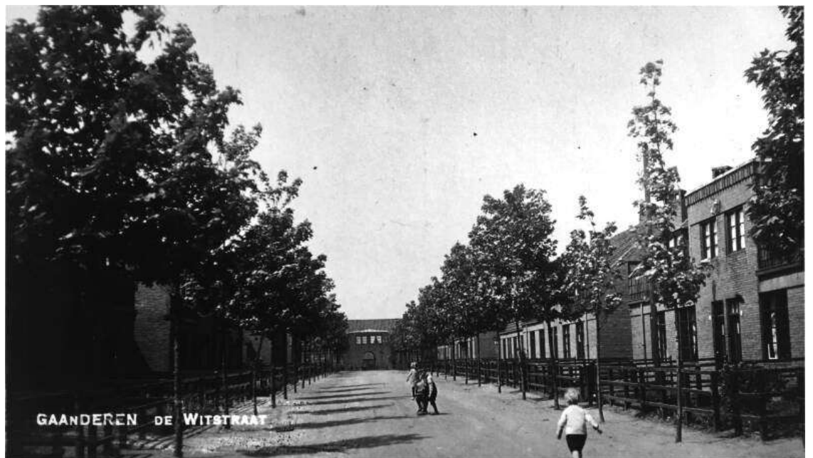
GAANDEREN DE WITSTRAAT