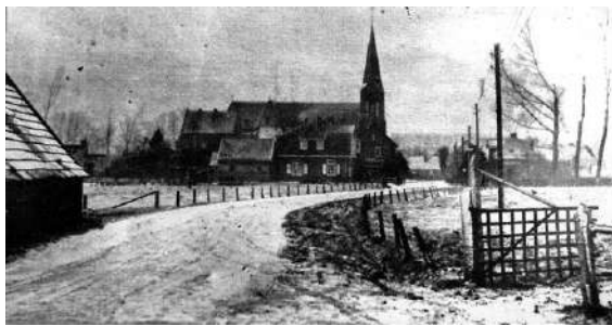
Foto: winters plaatje van Gaanderen in vroeger tijden.