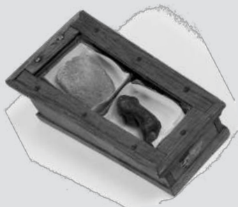
Op de foto: vinger en tong van gebr. De Witt. Collectie Haags Historisch Museum.