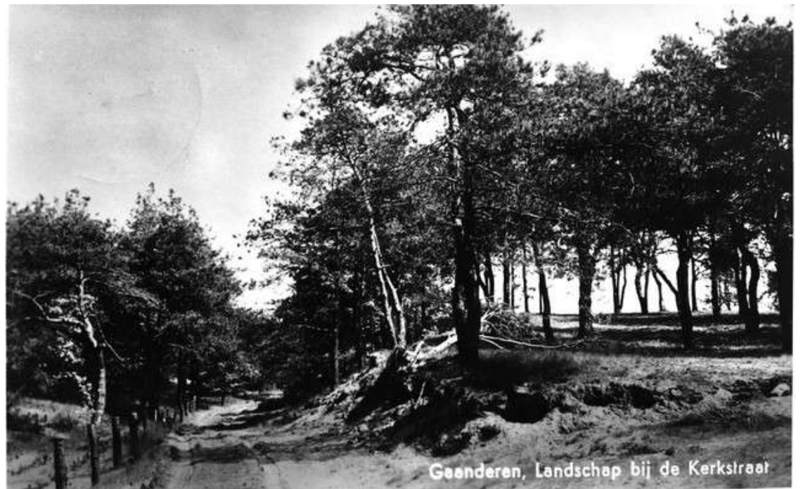
Gaanderen, Landschap bij de Kerkstraat

- De Witstraat waar een keer per jaar de verlotingsmarkt 'poggenmarkt' werd gehouden. Het was een drukte van belang en er werden ook biggen verhandeld. (Hoofdprijs was een vet varken.)