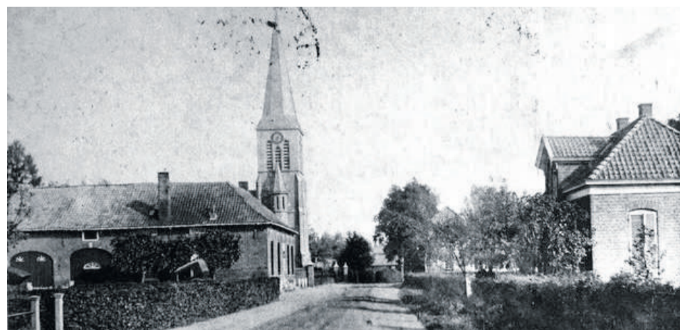
Gaanderen, de Kerkstraat in 1903, nog onverhard.