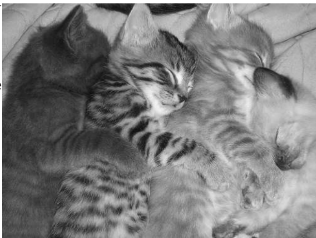
Foto: kittens spooning door Eli Duke, https://www.flickr.com/photos/elisfanclub/ https://en.wikipedia.org/wiki/Creative_Commons_license