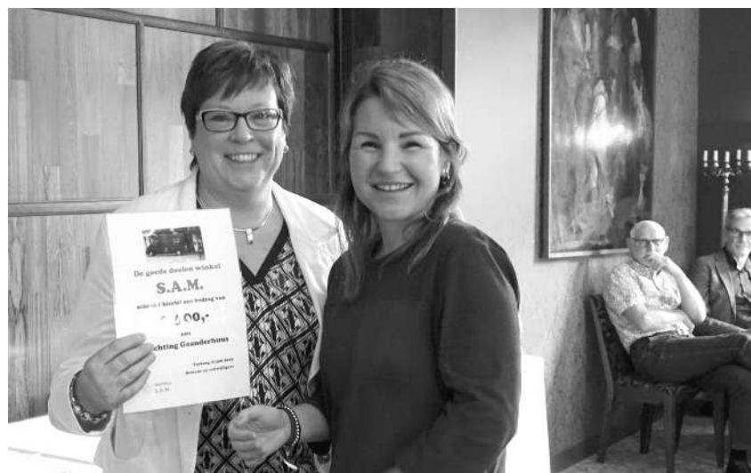
Foto: Annet Huntink (Gaanderhuus) en Esther van Emden (S.A.M. penningmeester)