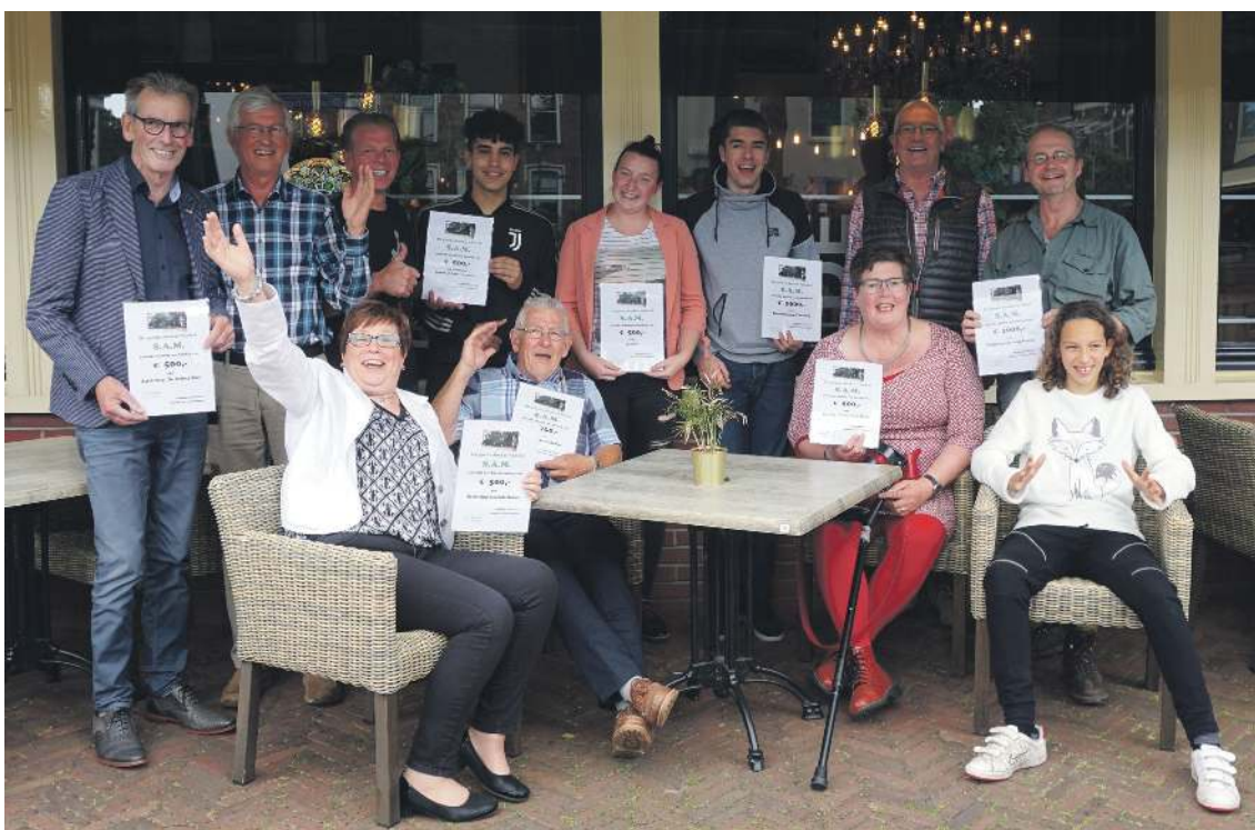
Op de foto: de ontvangers van de donaties van Stichting S.A.M.

de Graaf: "Wie arbeidsongeschikt raakt, krijgt van alles voor zijn kiezen. Moeite met dagritme en zelfwaardering en daar bovenop de wirwar van uitkeringen en regelingen." De WAO Club Achterhoek helpt zowel met de papierwinkel als met activiteiten en lotgenotencontact in de Trefkuul. "Dit jaar kunnen we met het bedrag ons wedstrijdrijlaken vervangen." >> pagina 2