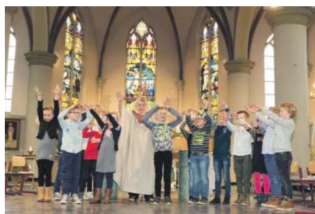
Foto: Kennismakingsviering