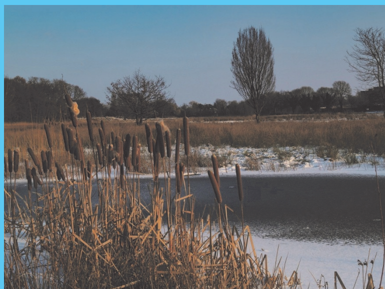
Koning Winter regeert in Gaanderen. Ik heb liever een warme kachel...