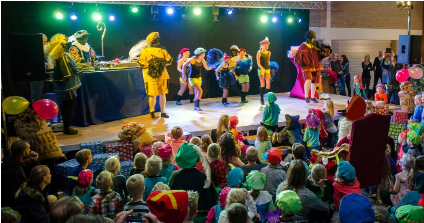
Foto: Pietenparty 2016

Het is officieel bevestigd: Sinterklaas komt komend weekend naar Gaanderen. Alle kinderen zijn daarom aanstaande zondag 19 november om 14.00 uur welkom op de Pietenparty met de Sint als 'special guest'.