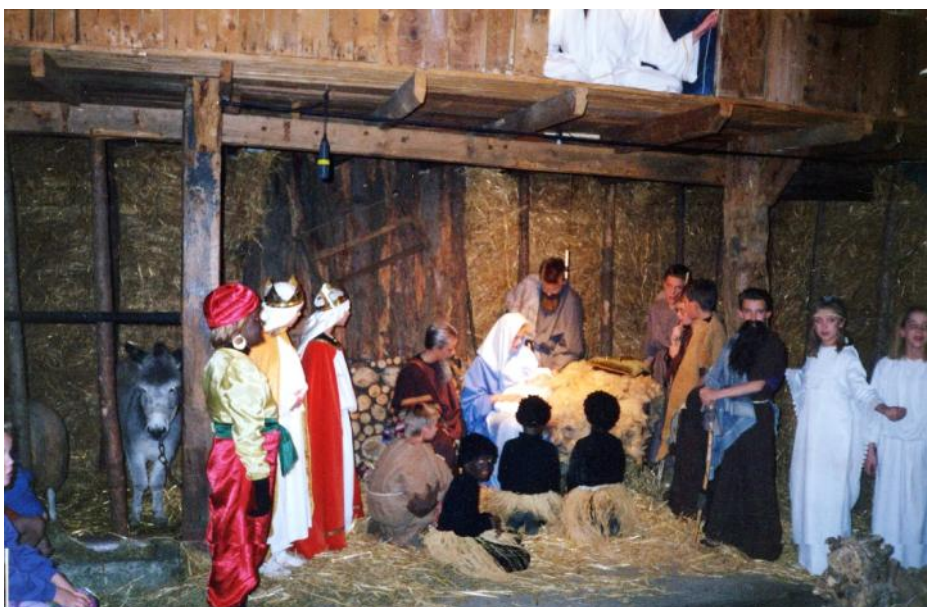
Foto's: een kerststal in Gaanderen van weleer, optocht met de G-sleuteltjes

Het wordt een warm en feestelijk samenzijn, waar men knus saampjes of met de hele familie van kan genieten. Met veel mooie muziek, liedjes om stil naar te luisteren, maar ook om heerlijk mee te zingen bij een vuurtje. Theater, muziek, mooie verhalen, ontmoetingen, een knutselhoek, warme chocola, kaarslicht en glühwein. MPG is druk bezig met de voorbereidingen. Het belooft een