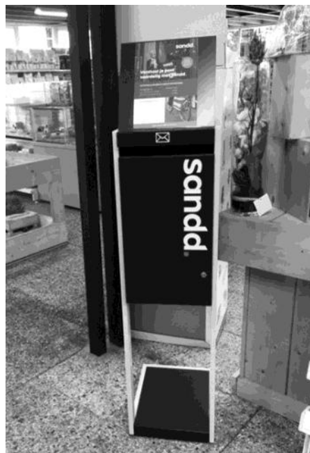
Foto: de brievenbus in de winkel

Postzegels van deze, voor sommige misschien nog minder bekende, postbezorgdienst zijn er ook te koop.