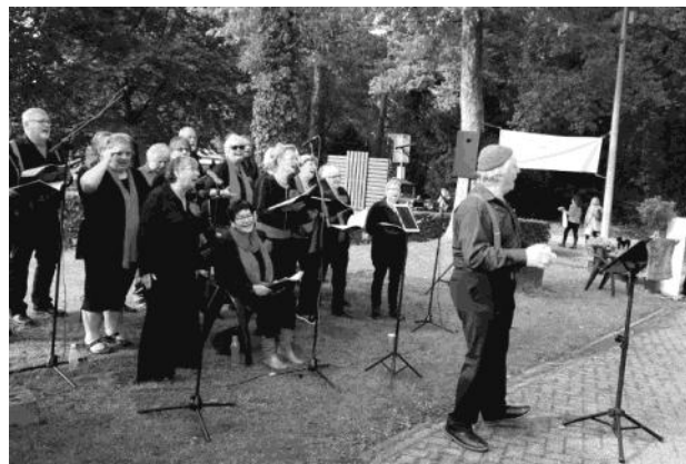
Het koor op de Slangenburgse Nazomerdagen 2017

Gaanderens Koor Janboel en de gastkoren De Stroatkjals uit Luttenberg en Kiekan van de Heelweg houden zondagmiddag 8 oktober een Korenfestival in Het Onland. Ze sluiten om 17.00 uur af met een samenzang van alle drie de koren en het publiek.