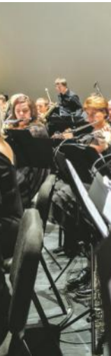
Op de foto links